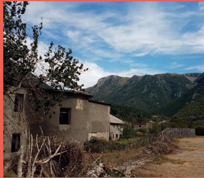
Die Armut und Not in den abgelegenen Dörfern ist unbeschreiblich.

Die ehrenamtlichen Helfer aus Österreich schaffen einen Spagat zwischen der albanischen und österreichischen Kultur. Sie respektieren die Albaner, ihre Helfer vor Ort, so wie sie sind und